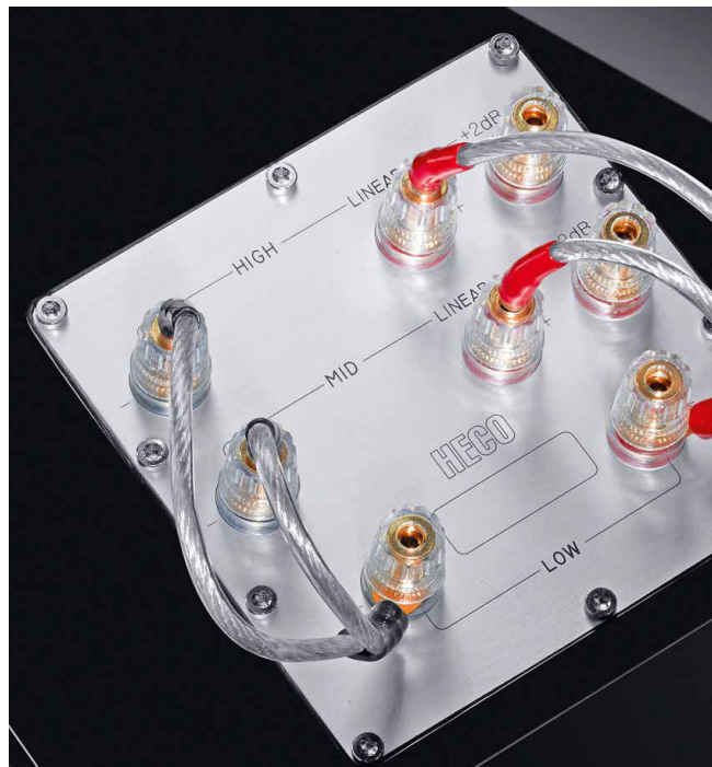
在背面的最底下有多組喇叭線接端，除了是Tri-wire設計之外，高音與中音還有Linear與+2dB的量感增加。