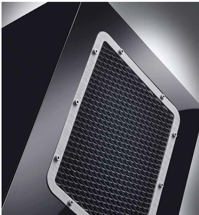
Concerto Grosso的中音是帶有反射孔的，不過並不是一般圓形的反射孔，而是非常規反射孔，稱為Aperiodic Damping。